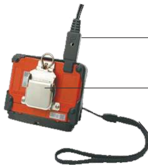
Adaptador de CA (Part No. 2594 0898 30)