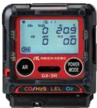
Apariencia cuando esta colocada.