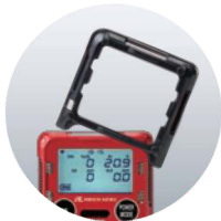
Cubierta protectora (Part No. 4777 4161 10)